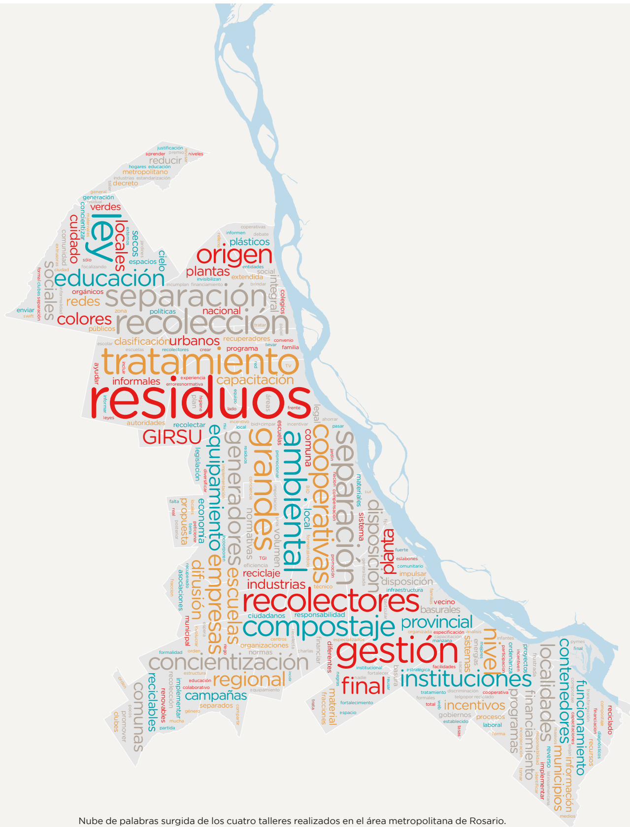
Nube de palabras surgida de los cuatro talleres realizados en el área metropolitana de Rosario.